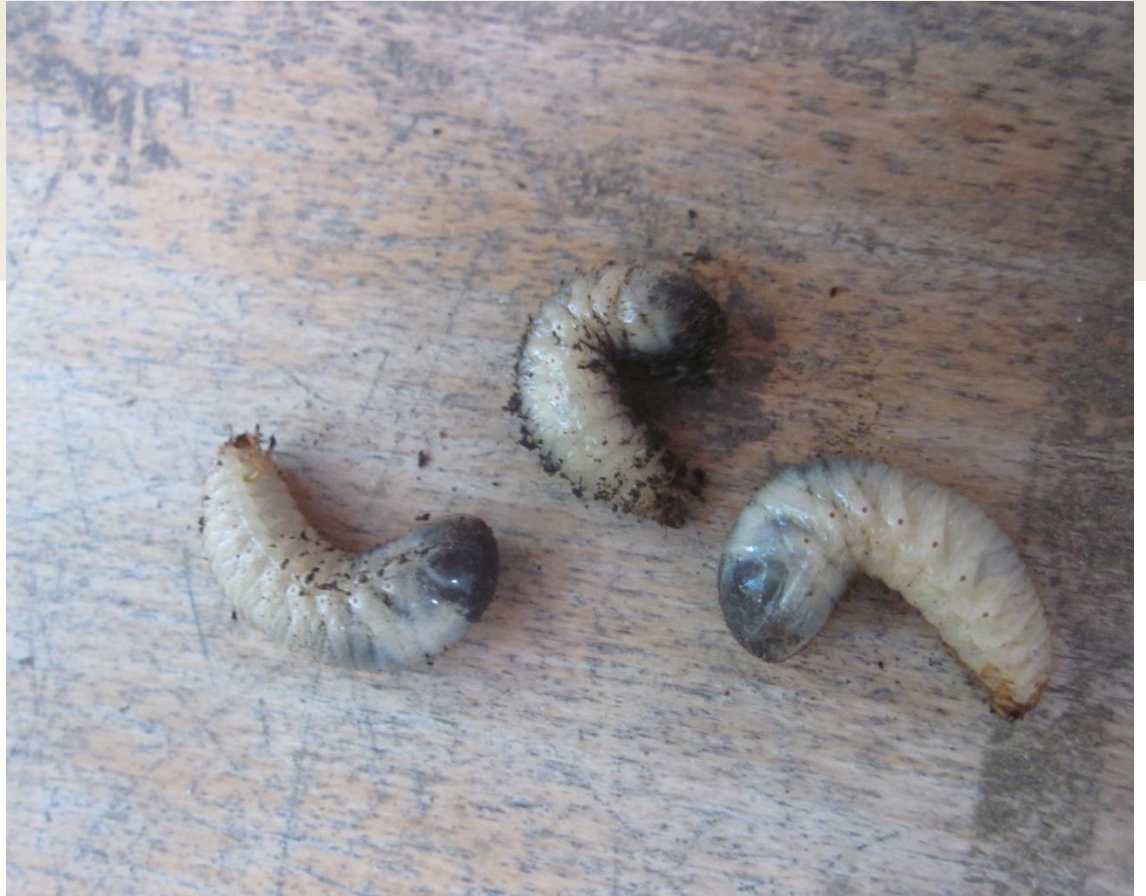
Geheimnisvolle Lebewesen entdeckt!